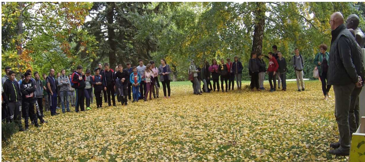
Eredményhirdetés Nagymátén, a Fekete István Fűvészekertben

A verseny szervezőinek (Duna-Dráva NPI, Mecsekerdő Zrt. Sásdi Erdészete, Dombóvári Fekete István Kulturális Egyesület, Ajkai Fekete István Irodalmi Társaság, Janus Pannonius Múzeum Természetudományi Osztálya) reményei szerint a rendezvénnyel évről évre sikerül továbbvinni és a gyerekekbe oltani az író örök törekvését, a magyar táj szeretetét és védelmét.