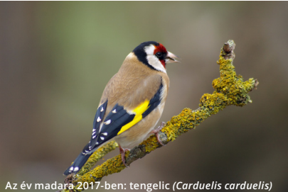
Az év madara 2017-ben: tengelic ( Carduelis carduelis )

Október 1. IDŐSEK VILÁGNAPJA A PINTÉR-KERT ARBORÉTUMBAN Helyszín, időpont: Pécs, Pintér-kert Arborétum, 10.00 és 14.00 óra