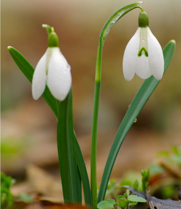
Az év vadvirága 2017-ben: Hóvirág ( Galanthus nivalis )